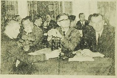
Fragment sali obrad.